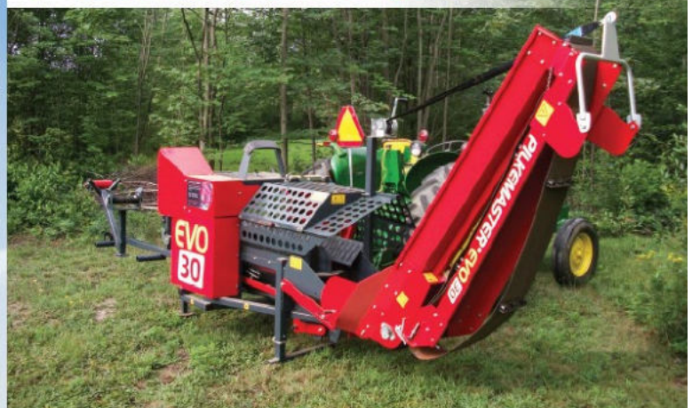
PROCESSEUR À BOIS